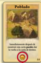
Punto de victoria

El primer jugador que consiga llegar a 10 puntos de victoria con las cartas que tenga sobre la mesa gana la partida.